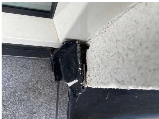
Bild 1: Utvändigt, Fasad, Nedersta plåten på fasaden har släppt vid entredörren