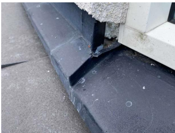
Bild 2: Utvändigt, Fasad, Putssläpp finns vid ett fönster vid runda delen av huset